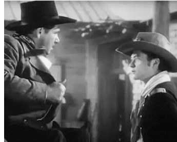
1939 LA CHEVAUCHÉE FANTASTIQUE (Stagecoach) de John Ford avec G. Bancroft