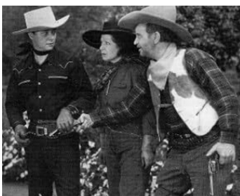
1941 LES FAUSSAIRES DE LA PAMPA (Dude Cowboy) de D. Howard avec H. Holmes, R. Whitley