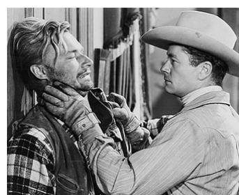
1951 TRAIL GUIDE de Lesley Selander avec Frank Wilcox