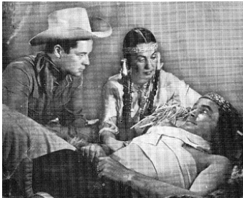
1948 INDIAN AGENT de Lesley Selander avec Claudia Drake, Noah Beery Jr