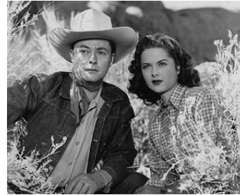
1947 LE PIC DE LA MORT (Thunder Mountain) de Lew Landers avec Martha Hyer