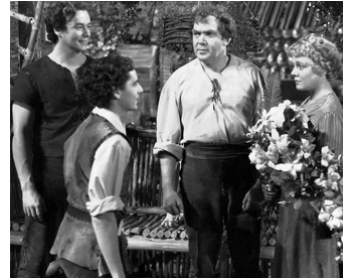
1940 SWISS FAMILY ROBINSON d'E. Ludwig avec F. Bartholomew, Th. Mitchell, Edna Best