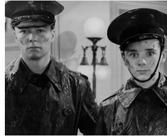
1938 LES CADETS DE CULVER (Spirit of Culver) de Joseph Santley avec Freddie Bartholomew