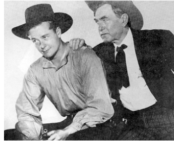
1938 LAW WEST OF TOMBSTONE de Glenn Tryon avec Harry Carrey