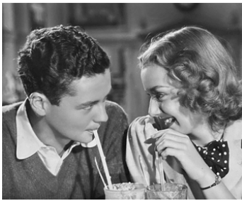
1937 STELLA DALLAS (Stella Dallas) de King Vidor avec Anne Shirley