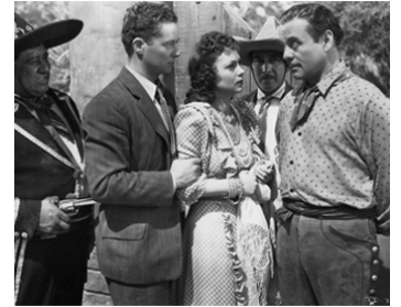
1939 THE GIRL AND THE GAMBLER de Lew Landers avec Steffi Duna, Leo Carrillo