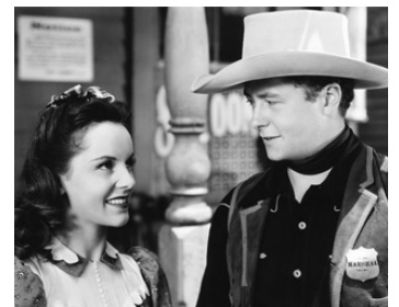
1941 LE SENTIER DES BANDITS (The Bandit Trail) d'Edward Killy avec Janet Waldo