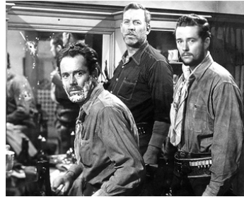
1946 LA POURSUITE INFERNALE (My Darling Clementine) de J. Ford avec H. Fonda, W. Bond