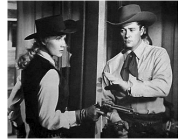
1949 DYNAMITE DANS LA VALLÉE (Dynamite Pass) de Lew Landers avec Jacqueline White