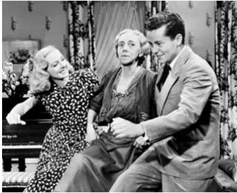
1938 LES FILS DE LA LÉGION (Sons of the Legion) de James P. Hogan avec Evelyn Keyes