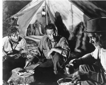
1948 LE TRÉSOR DE LA SIERRA MADRE de John Huston avec H. Bogart, Walter Huston