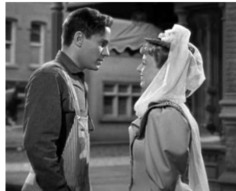
1941 BACK STREET (Back Street) de Robert Stevenson avec Margaret Sullivan