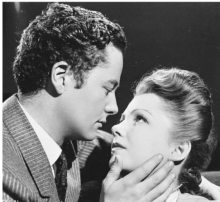
1942 LA SPLENDEUR DES AMBERSON (The Magnificent Ambersons) d'Orson Welles avec Anne Baxter