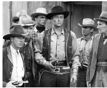
1942 LES PIRATES DE LA PRAIRIE (Pirates of the Prairie) d'H. Bretherton avec Karl Hackett