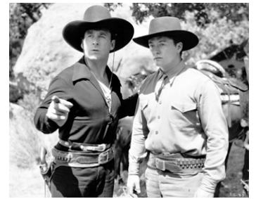
1938 POLICE MONTÉE (The Renegade Ranger) de David Howard avec George O'Brien