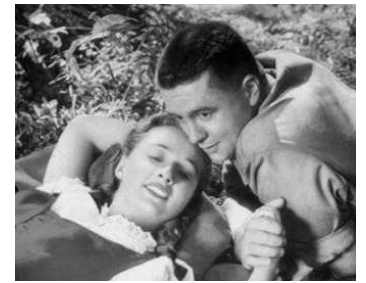
1943 LES ENFANTS D'HITLER (Hitler's Children) d'Edward Dmytryk avec Bonita Granville