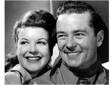
1947 NID DE PIRATES (Under the Tonto Rim) de Lew Landers avec Nan Leslie