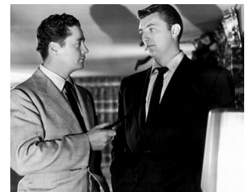
1951 FINI DE RIRE (His Kind of Woman) de John Farrow avec Robert Mitchum