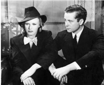
1939 UN ANGE EN TOURNÉE (Fifth Ave. Girl) de Gregory La Cava avec Ginger Rogers