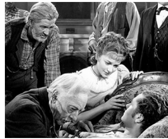
1937 LA BATAILLE DE L'OR (Gold is where you find it) de M. Curtiz avec Olivia de Havilland